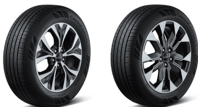
235/60 R18 타이어&전면가공 휠