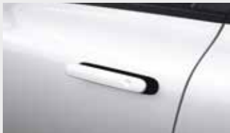
오토플러시 도어 핸들