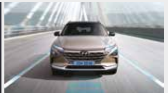
차로 유지 보조/차로 이탈방지 보조/ 고속도로 주행 보조