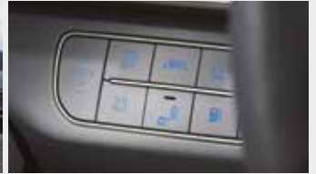
물 배출 스위치