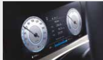
클러스터(10.25인치 컬러 LCD)