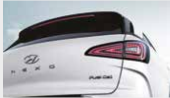
LED 리어 콤비 램프/히든 리어 와이퍼