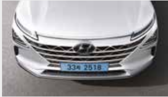
호라이즌 포지셔닝 램프/ 분리형 컴포지트 LED 헤드램프/캐스캐이딩 그릴

좌우를 연결하는 호라이즌 포지셔닝 램프와 공기역학을 고려해 설계된 오토플러시 도어 핸들이 미래지향적인 이미지를 완성해줍니다.