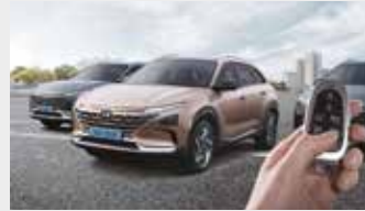
원격 스마트 주차 보조

머릿속으로만 그려왔던 미래가 혁신적인 모빌리티의 모습으로 눈앞에서 펼쳐집니다. 다가올 미래를 일상에서 먼저 누리는 특별한, 그 중심에 NEXO가 있습니다.