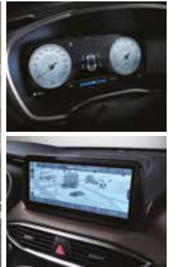
클러스터(12.3인치 컬러 LCD) 10.25인치 내비게이션