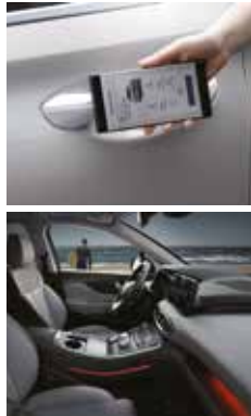
디지털 키 앰비언트 무드램프