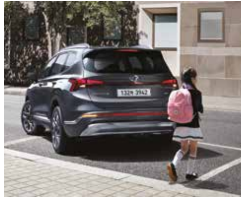
후방 주차 충돌방지 보조