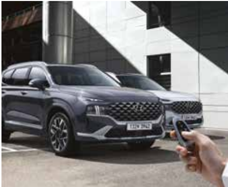
원격 스마트 주차 보조