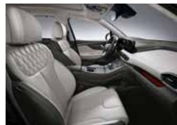
라이트 그레이 나파가죽 시트