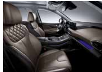
다크 베이지 가죽 시트