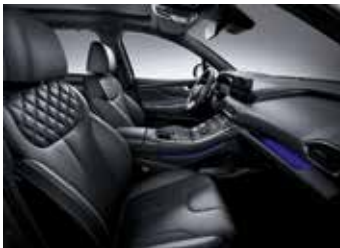
블랙 모노톤 가죽 시트