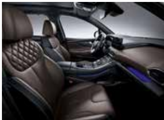
브라운 가죽 시트