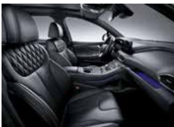
블랙 모노톤 나파가죽 시트