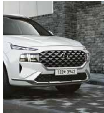
크롬 라디에이터 그릴 및 스키드 플레이트