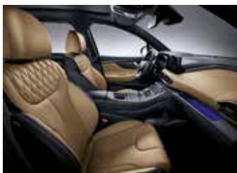
카멜 나파가죽 시트