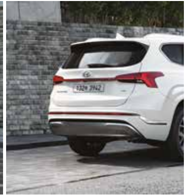
LED 리어 콤비램프 및 크롬 스키드 플레이트